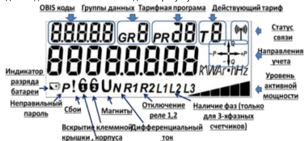
Рисунок 2 - Загальний вигляд дисплея лічильника з OBIS-кодами

2.2.5 Зовнішній вигляд дисплея та зони індикації на дисплеї основних інформаційних даних і допоміжних символів наведені на рисунку 2.